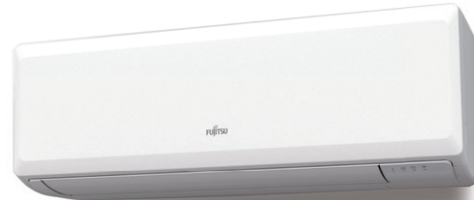
ASY 25 -35 UI-KP