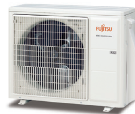
ASY 25 -35 UI-KP